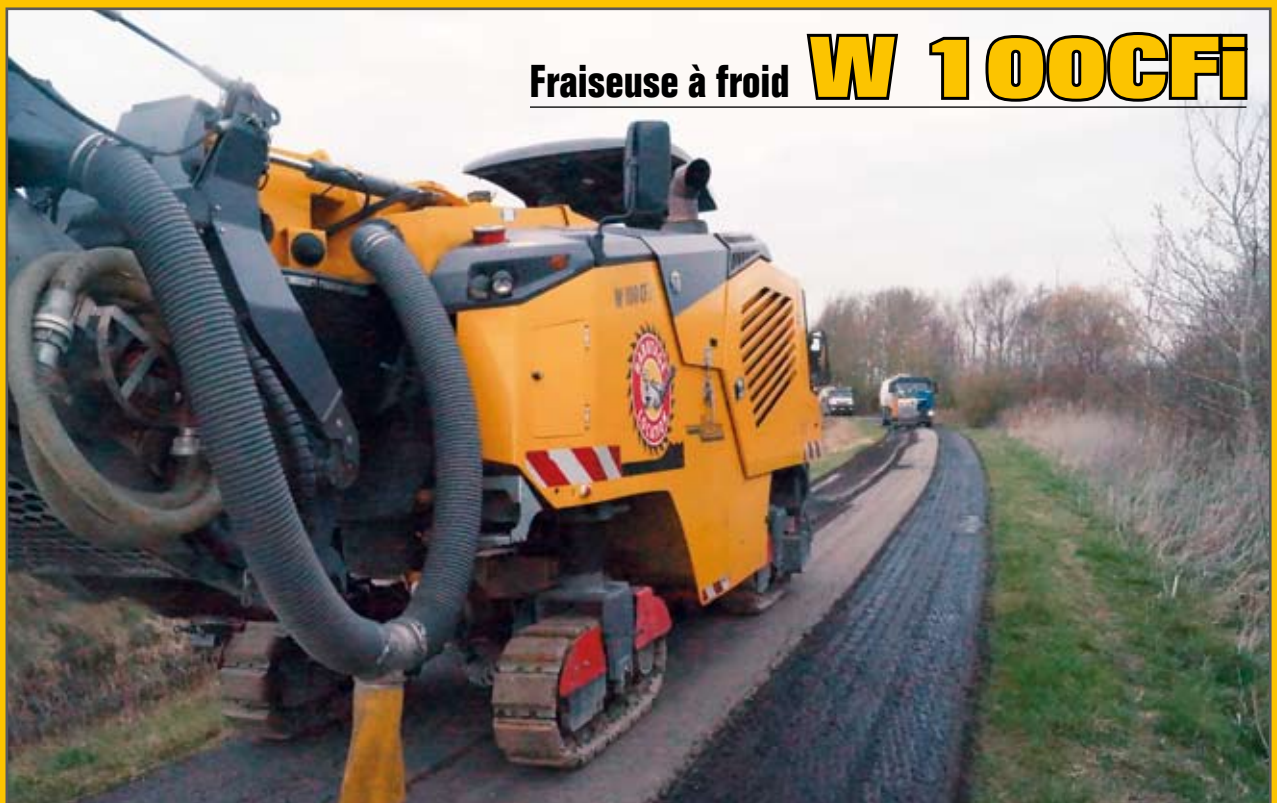
Fraiseuse à froid W 100CFi